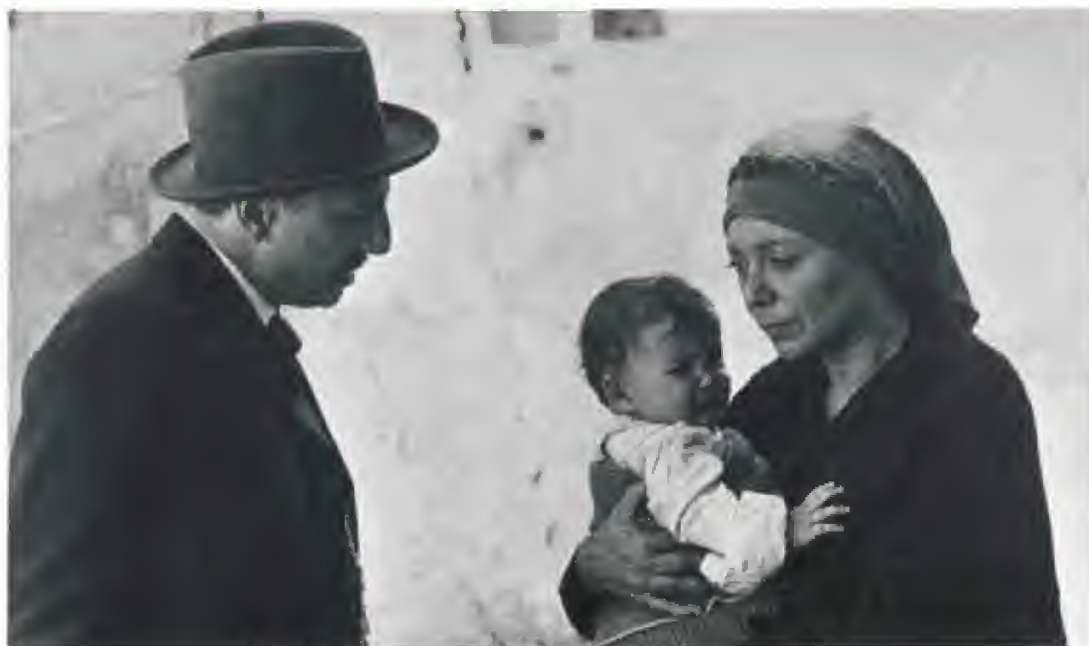
Héctor Alterio - Amparo Soler Leal